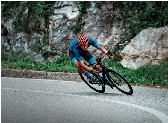
我们重视健康和福祉