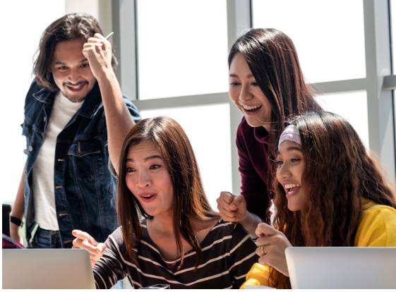
我们重视包容性和多样性