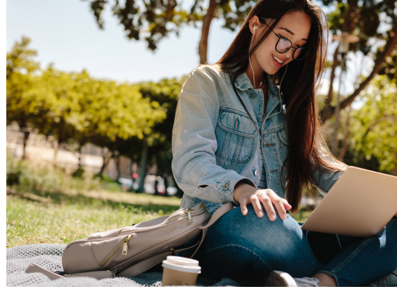
我们重视学习和发展