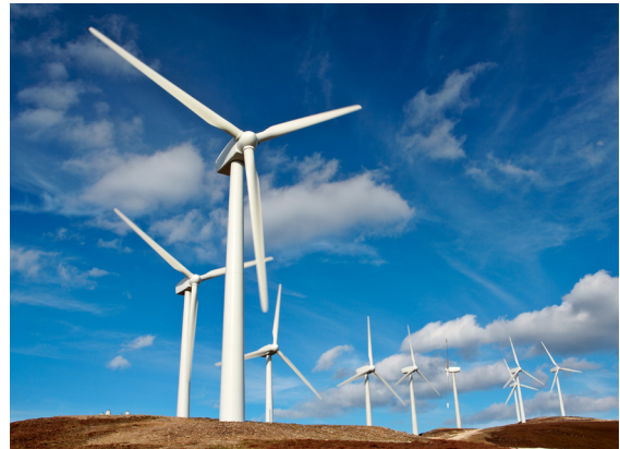
我们重视社会和地球

当您成为 Allianz L.E.A.P. 的一份子,我们非常重视您能直接成为 Allianz 的见习生甚至成为我们的员工。